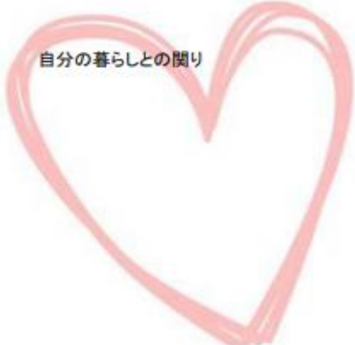
自分の暮らしとの関り