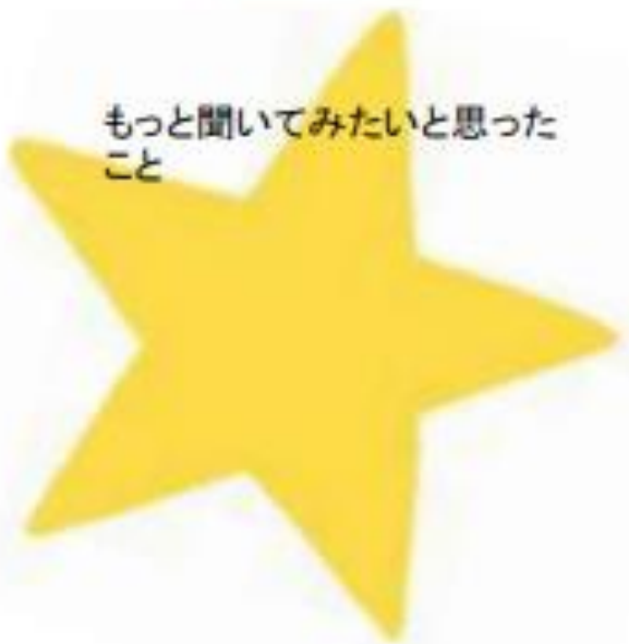
もっと聞いてみたいと思ったこと