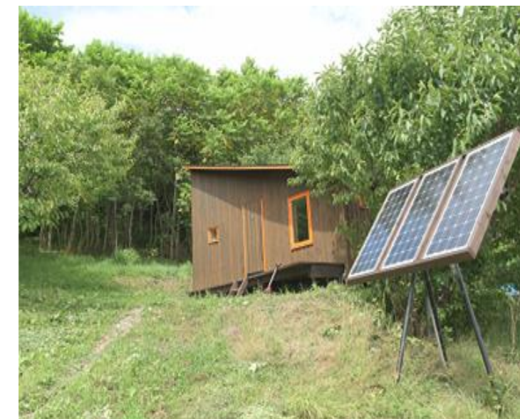
エコビレッジ コース